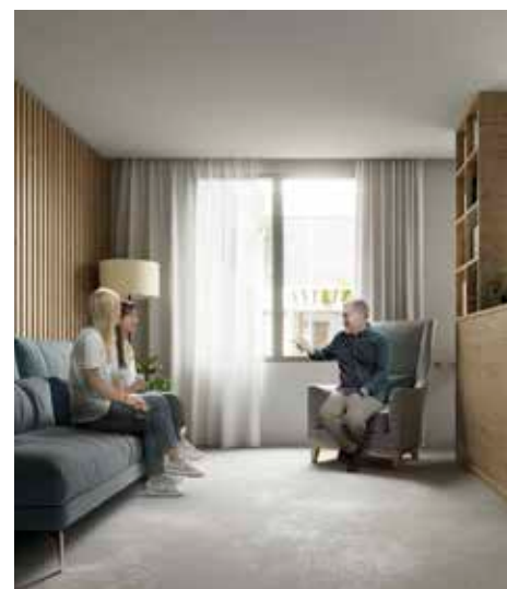
Espais sense ús de l'Hospital de Sant Andreu s'adequaran per fer realitat aquest centre de pal·liatiu a Manresa

ta de pal·liatius i que es farà realitat mitjançant l'adequació de l'edifici d'habitatges al número 14 del carrer de l'Hospital, per on s'entrarà, i d'un pati i una ala del recinte on hi ha l'Hospital Sant Andreu ara sense ús; s'intervindrà en 1.400 m 2 .