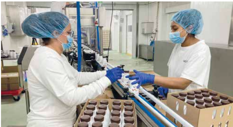
Les instal·lacions de productes del Moianès amb seu a la capital de la comarca.

El quefir és una beguda fermentada probiòtica amb nombroses propietats i beneficis per a la salut. Segons els experts, entre els punts forts hi ha que facilita la digestió; enforteix el sistema immunitari; combat la inflamació intestinal,