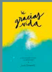
Gracias vida ¿Y qué hacemos ahora?... Seguir bailando Autors: LUCIA BE - Editorial: LUNWERG