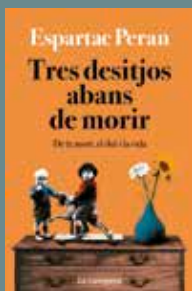
Tres desitjos abans de morir Autor: ESPARTAC PERAN Editorial: La Campana