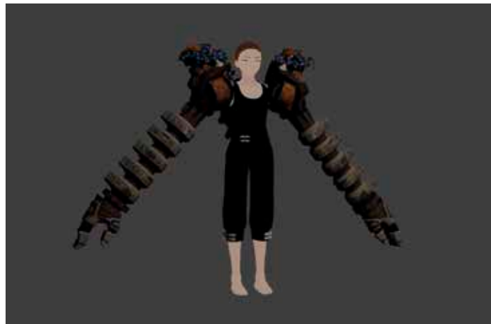
Un detall del 'Golem Soldiers'

Canal Taronja de televisió va lliurar els premis atorgats durant la VIII Gala dels Serveis d'Ordenació dels Serveis de Règim Especial del Departament d'Educació de la Generalitat de Catalunya. La gala es va veure en streaming i en directe el 5 de maig i també a través de les televisions de TDI.