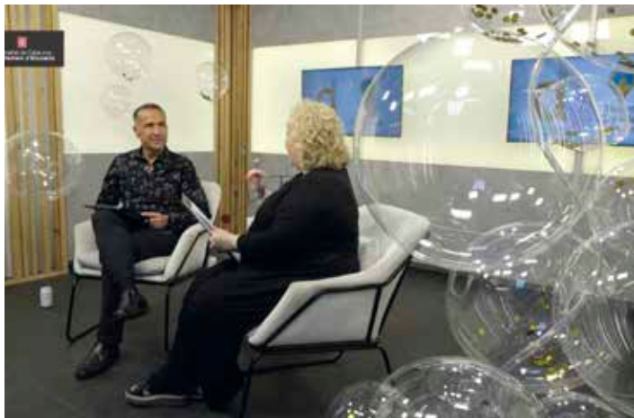
Així lluïa el plató el dia de la VIII Gala d'Arts Plàstiques i Disseny