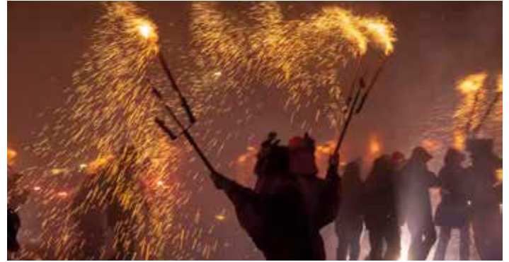
Canal Taronja TV us portarà a casa tot allò que passà durant la Festa Major de Manresa

E l 19 d'agost ja arrenca la Festa Major de Manresa amb un seguit d'activitats pensades per a totes les edats. Des del tradicional castell de focs, passant per la trobada de bateries, les activi-