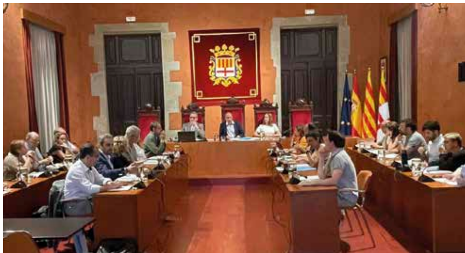
Plenari de constitució de l'Ajuntament de Manresa en el segon mandat de Marc Aloy com a alcalde