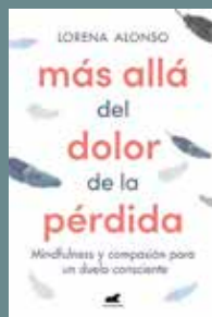
Más allá del dolor de la pérdida Autors: LORENA ALONSO Editorial: Vergara