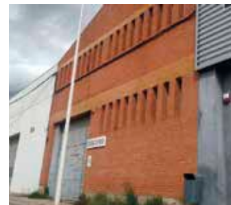
Nau on s'ubicarà la nova mesquita

L'octubre vinent obrirà la segona mesquita de la capital del Bages. És la que està adequant l'Associació Cultural Islàmica de Manresa a la nau industrial de 1.400 m 2 que va comprar l'abril de fa dos anys al polígon industrial dels Dolors. Tindrà cabuda per a 300 persones. L'associació ocupava un local al carrer de la Sèquia que els va quedar petit perquè només tenia 200 m 2 . La futura mesquita en té 1.200 més. Les obres s'han fet amb les donacions dels fidels i també hi ha ajudat la venda de l'antic local. Després de superar, ara fa un any, l'escull burocràtic que impedia a l'associació aconseguir la llicència, cosa que ha fet ara que l'obertura vagi més tard del desitjat i esperat per l'associació, es van fent les obres a mesura que es va disposant dels diners per pagar-les.