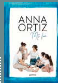
Mi luz Autora: ANNA ORTIZ Editorial: MONTENA